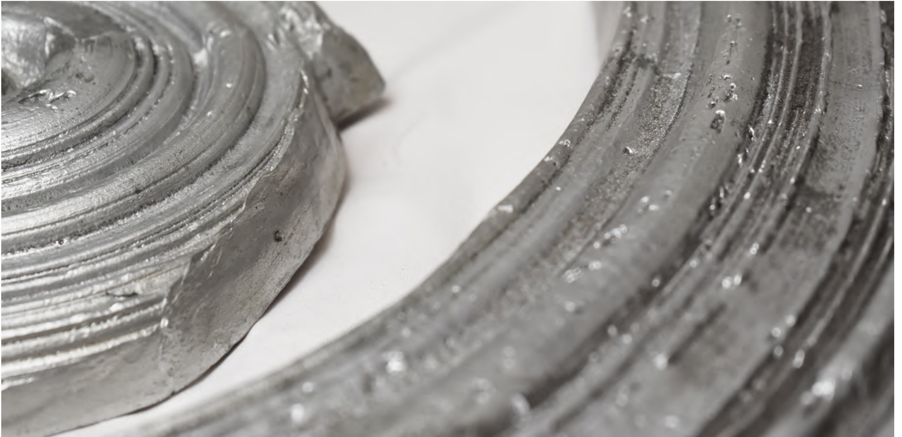
SERIE DE SCULPTURES EN FONTE D'ALUMINIUM